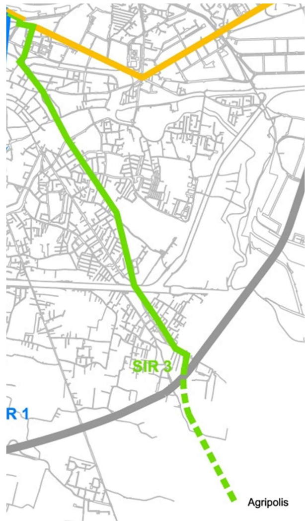
Figura 1 – tracciato indicativo della nuova linea SIR3

Dal punto di vista tecnologico, è confermata la tecnologia Translohr/Alstom, già utilizzata per il SIR1. Tale tecnologia si è consolidata nel corso dell'ultimo decennio, anche alla luce delle esperienze di applicazione in diverse aree urbane con oltre 135 veicoli attivi in diverse parti del modo. Tale evoluzione è stata pertanto considerata come